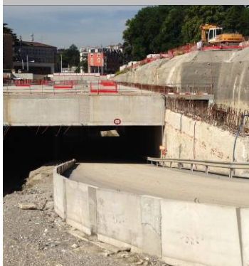
CEVA - gare des eaux Vives