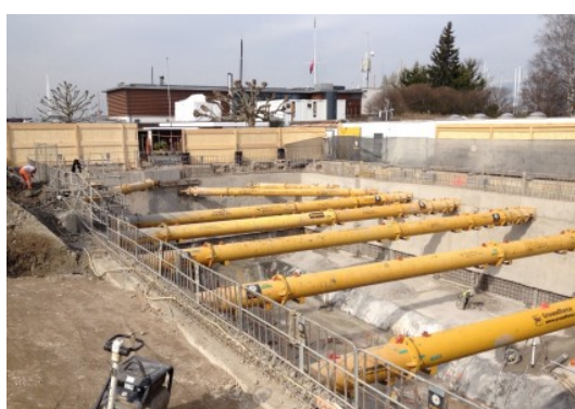
Spa de Genève-Plage