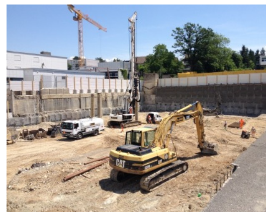
Hôpital de la Tour, nouveau bâtiment Meyrin