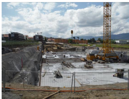
Eco quartier Les Vergers, Meyrin