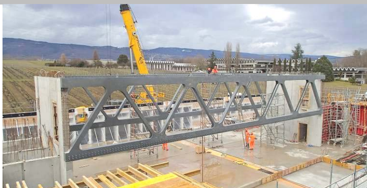
Agroscope de Changins