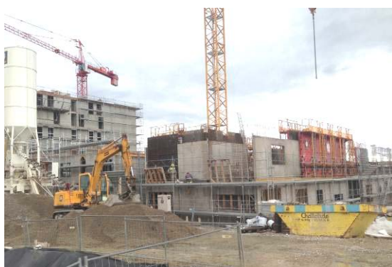
Petite Prairie, étape 1, Nyon